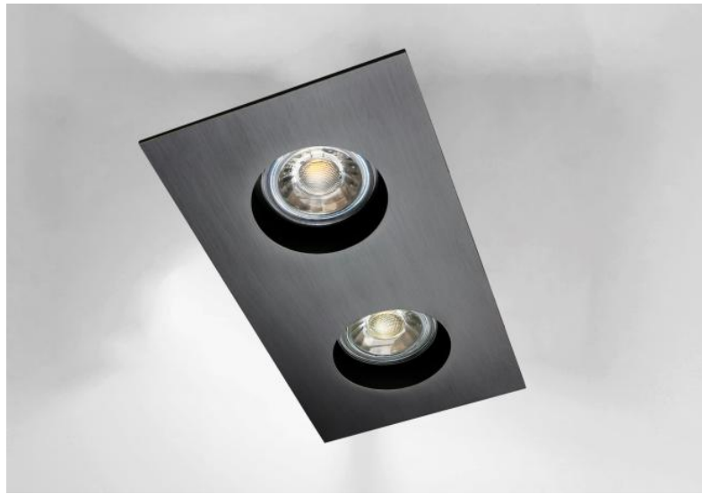
RIVERSIDE 2 en bronze griffé. Finition du métal : code 29