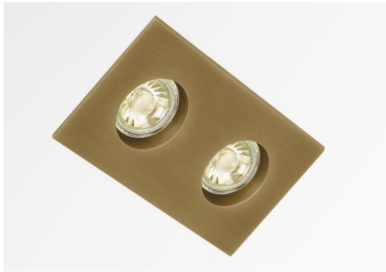
RIVERSIDE 2 en bronze léger