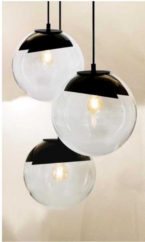
LUNA 3 o26 noir structuré (code 02) avec verres transparents (code 80)