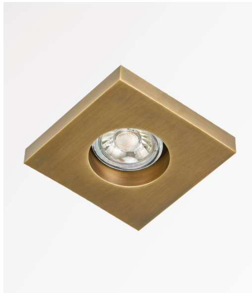
ORLANDO en bronze léger. Finition du métal : code 28