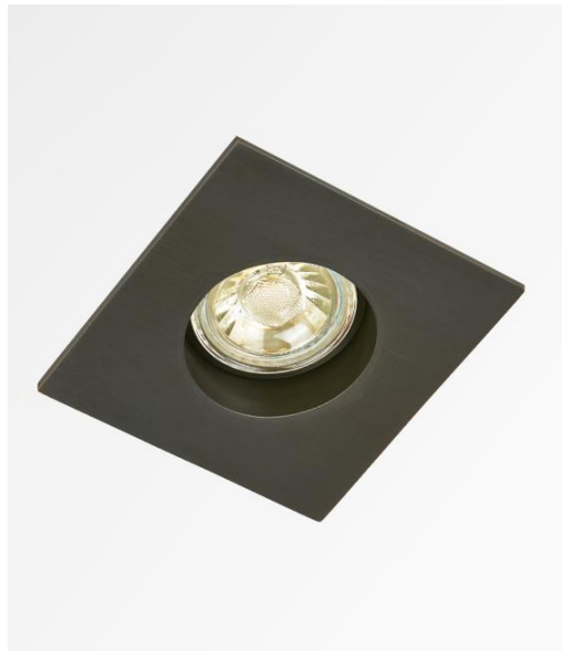
RIVERSIDE 1 en bronze griffé