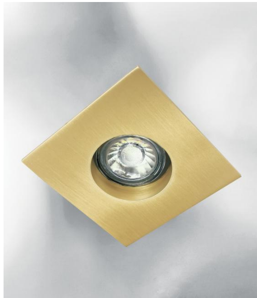
RIVERSIDE 1 en laiton satiné. Finition du métal : code 25