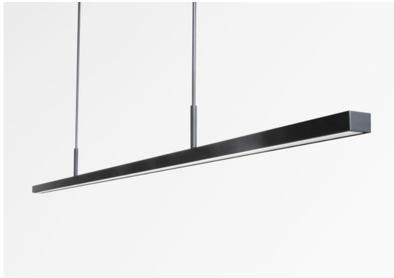
POLARIUS 150 en bronze griffé