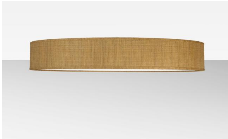
Abat-jour KENTIKA 80 FINE en Turda abricot (tissu de catégorie 3)