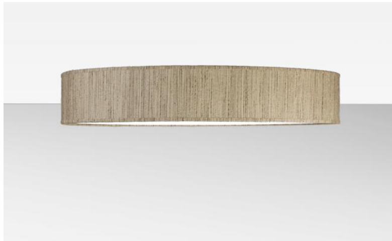
Abat-jour KENTIKA 70 FINE en Turda blond (tissu de catégorie 3)