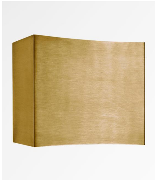
NAXOS en bronze léger