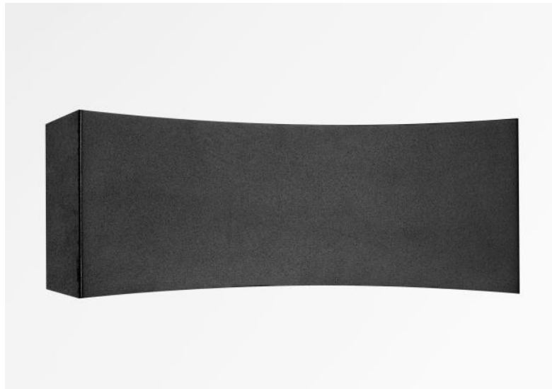
PHOBOS en noir structuré. Finition du métal : code 02