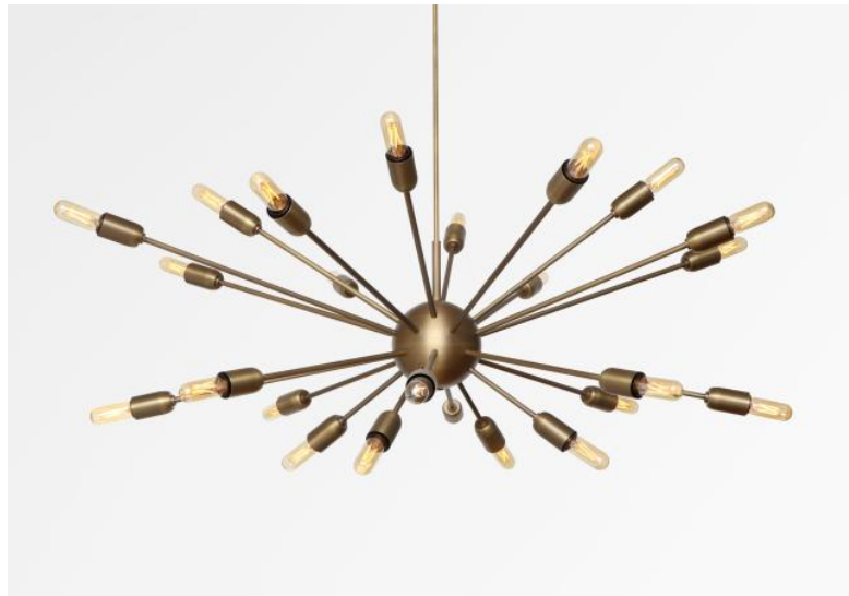
SOLAR 2 en bronze léger et ampoules GOLD