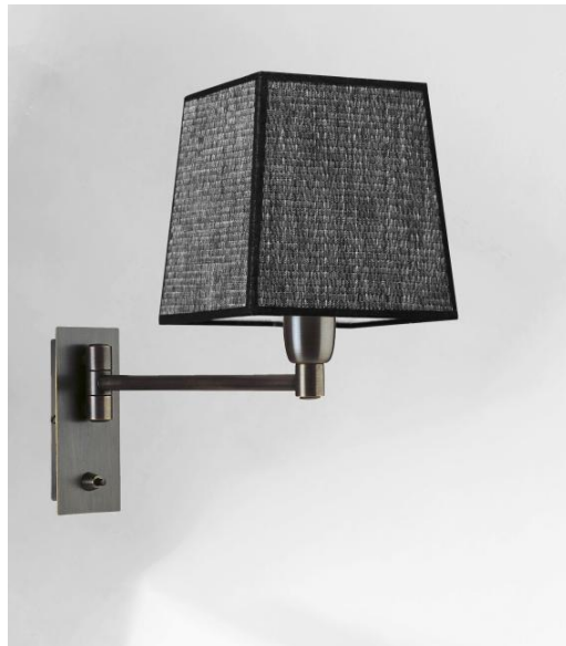
SOKARIS +SW en bronze griffé avec abat-jour en Parma Régisse (tissu de catégorie 4)