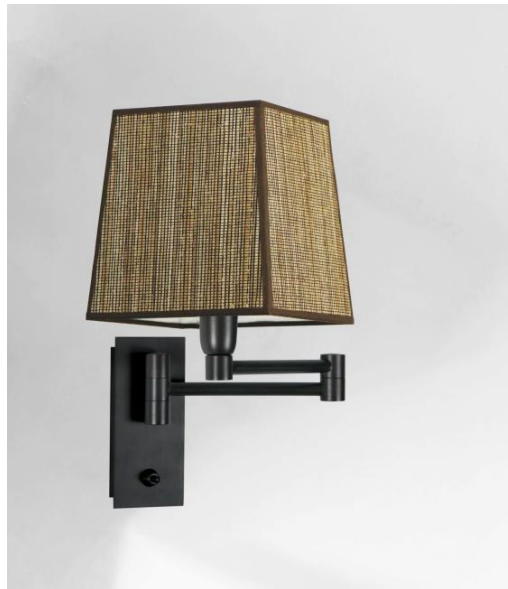
AHMOSIS +SW en bronze griffé avec abat-jour en Jacinthe Miel Noir (matière de catégorie 5)