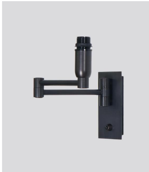
AHMOSIS +SW en bronze griffé sans abat-jour