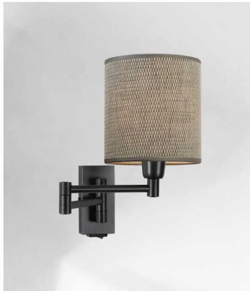
MAMMISI +SW en bronze griffé avec abat-jour en Parma Cendré (tissu de catégorie 4)