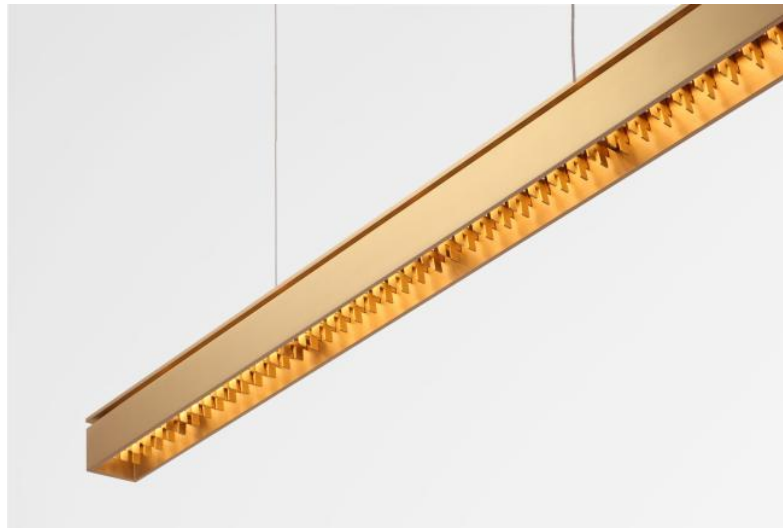
GALAND J # en laiton satiné. Finition du métal : code 25