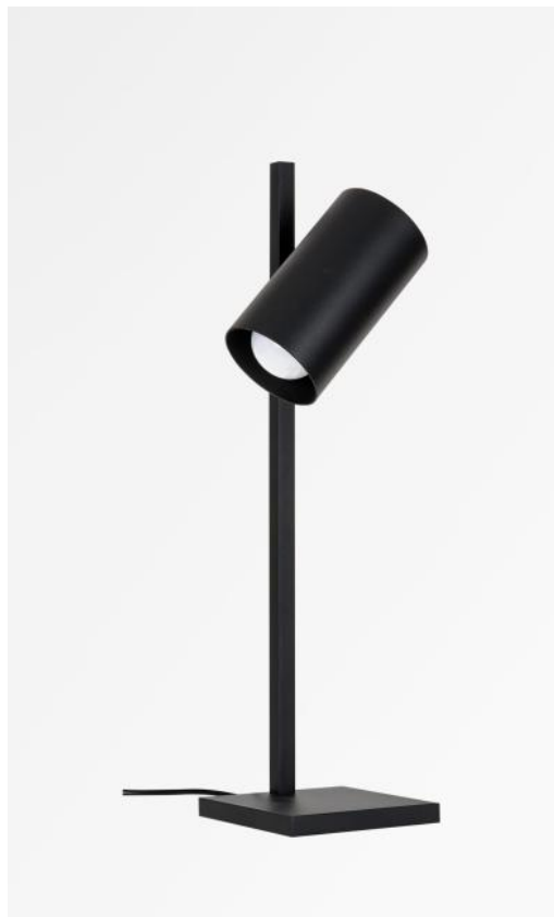
MIDAS en noir structuré. Finition du métal : code 02