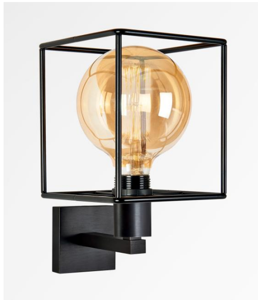
EXPLORER en bronze griffé avec structure KERMA et ampoule GOLD Ø125mm