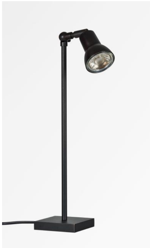
VENATOR 1 en bronze griffé