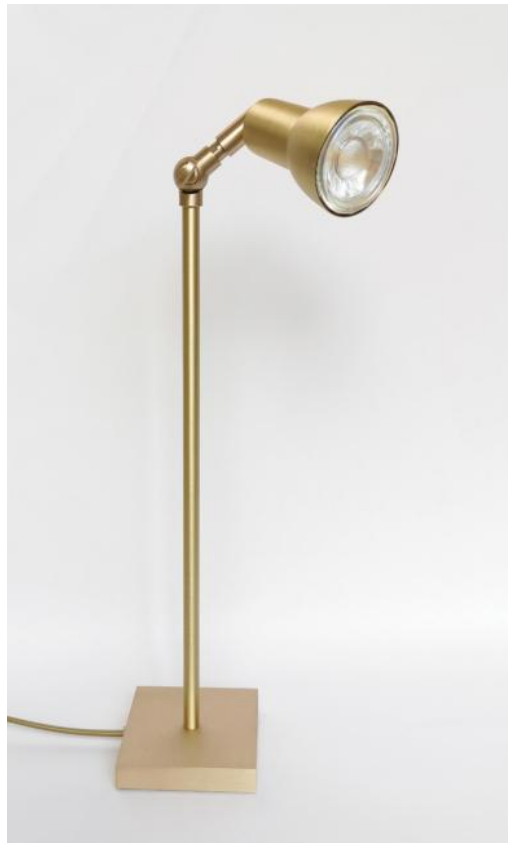
VENATOR 1 en laiton satiné. Finition du métal : code 25