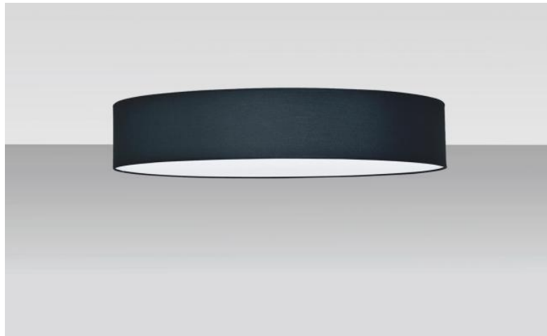
Abat-jour KENTIKA 55 FINE en Seta nuit (tissu de catégorie 3)