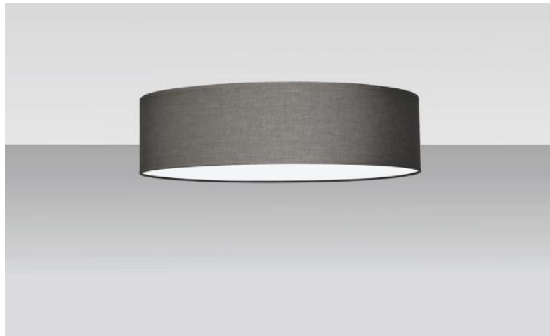
Abat-jour KENTIKA 45 FINE en Coton schiste (tissu de catégorie 1)