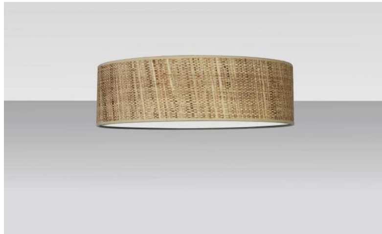
Abat-jour KENTIKA 45 FINE en Raphia Banane (matière de catégorie 3)