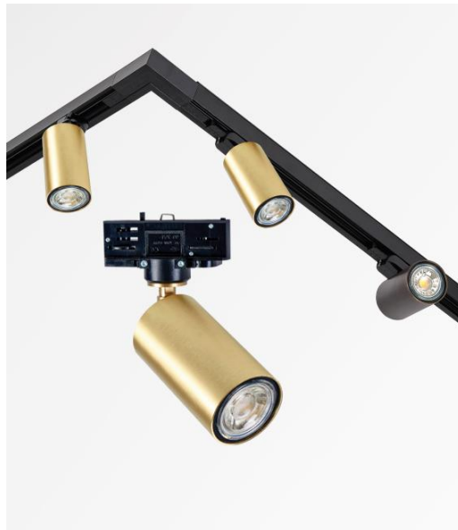
Rails + DEIMOS SPOTS pour rail en laiton satiné et en bronze griffé