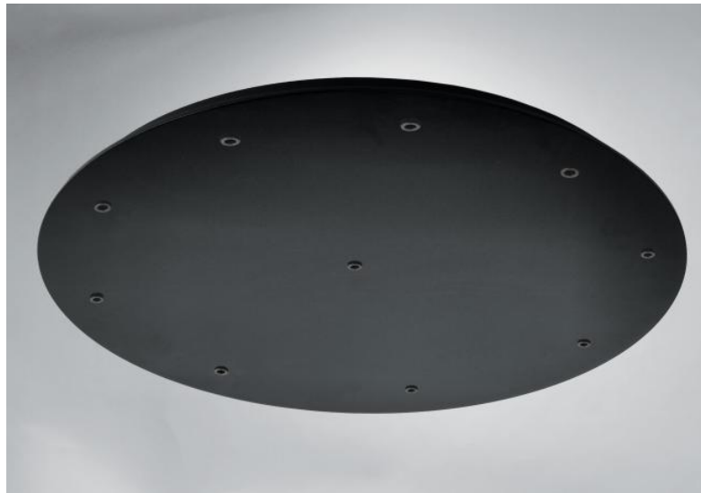
CEILING BASE 10 ø83 en noir structuré. Finition du métal : code 02. En option : un grand choix de câbles et de douilles (+supplément)