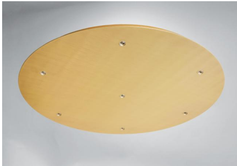
CEILING BASE 7 o48 en laiton satiné. Finition du métal : code 25. En option : un grand choix de câbles et de douilles (+supplément)