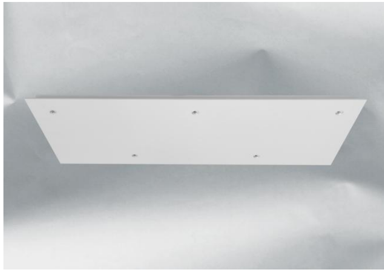
CEILING BASE 5 # en blanc structuré. Finition du métal : code 01. En option : un grand choix de câbles et de douilles (+supplément)