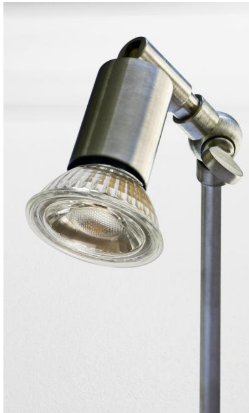
STARLIGHT 2 en nickel satiné