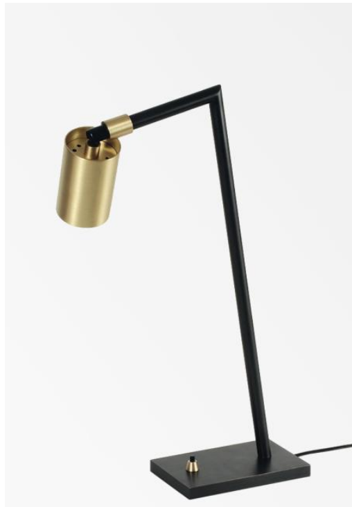
ZOSCA en bronze griffé et laiton satiné. Finitions du métal : code 95