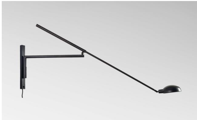
POLLUX +SW en bronze griffé