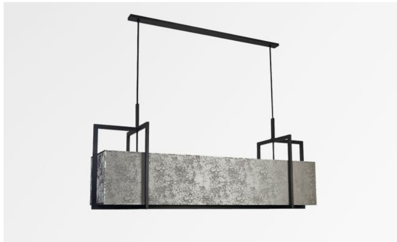
METELIS 125 en bronze griffé avec abat-jour en Gabala Platinum (tissu de catégorie 3)