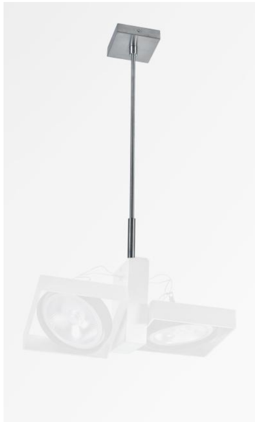
SARGAS 2 en chrome satiné monté sur une SARGAS 2 SUSPENSION