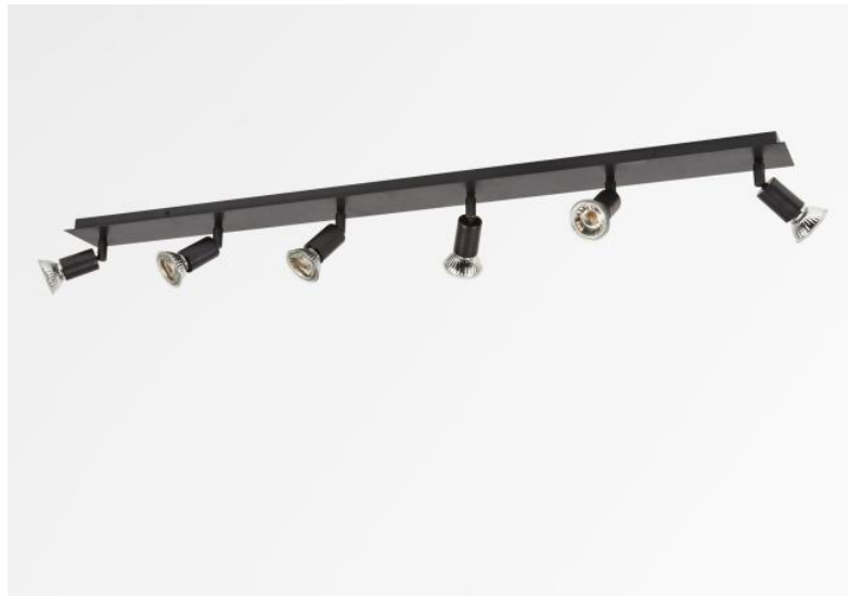
MERCURE 6 en bronze griffé. Finition du métal : code 29