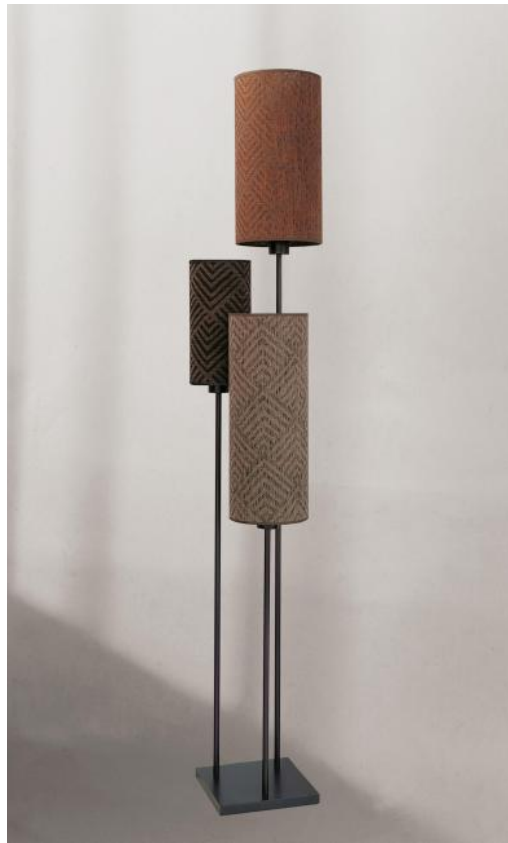
NOUKAR en bronze griffé avec abat-jour en Arrow (tissus de catégorie 4)