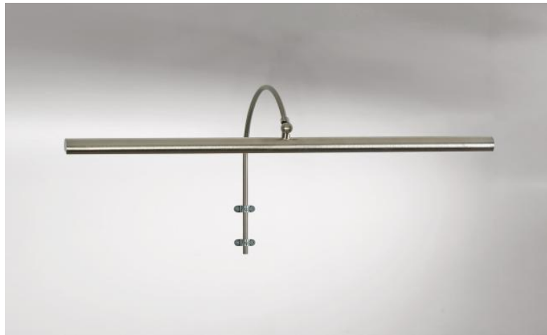
TRIANON 60 en nickel satiné. Finition du métal : code 33