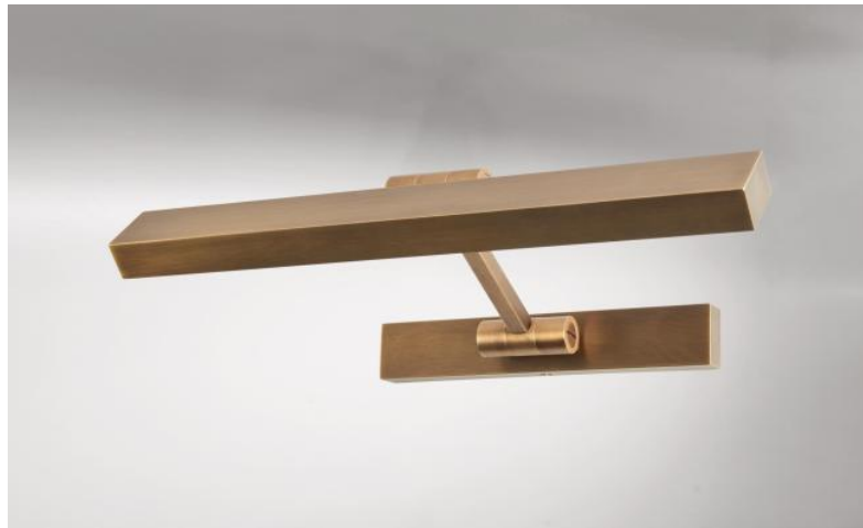
OUBA 35 en bronze léger. Finition du métal : code 28