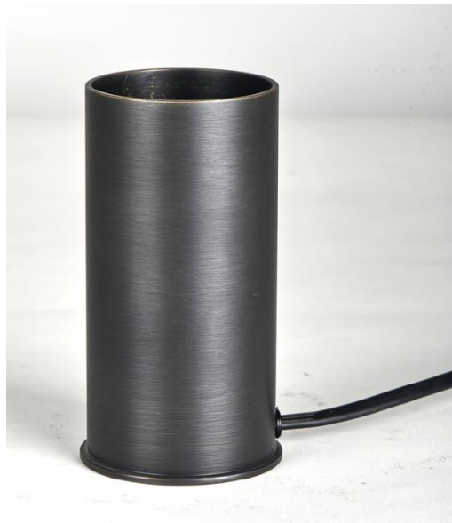
UP 12 en bronze griffé