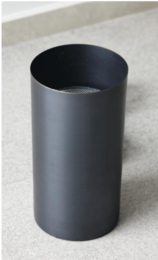
UP 38 en bronze griffé