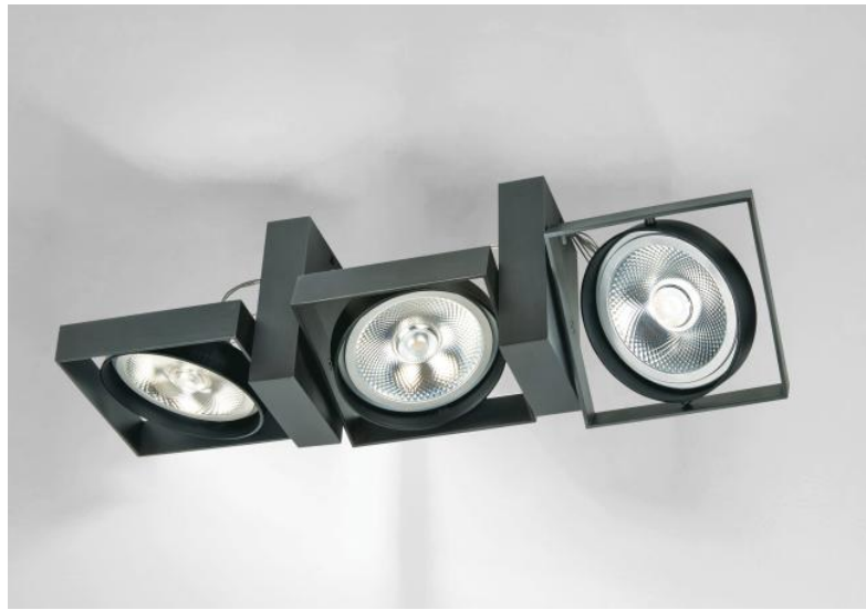
SARGAS 3 en bronze griffé. Finition du métal : code 29