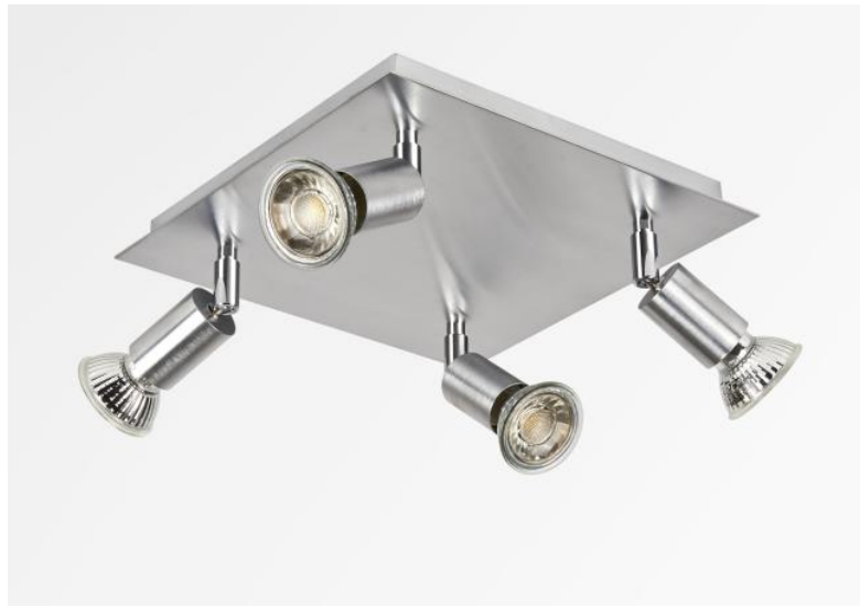
MERCURE SQUARE en chrome satiné. Finition du métal : code 32