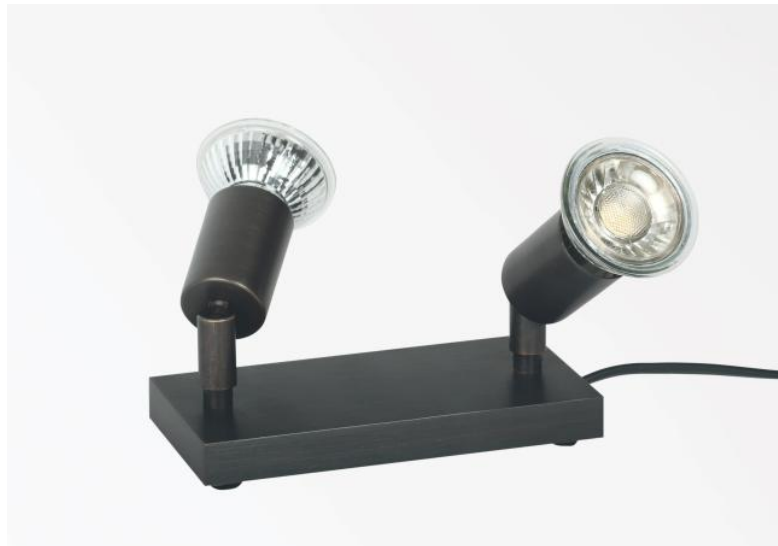
MERCURE PL2 en bronze griffé. Finition du métal : code 29