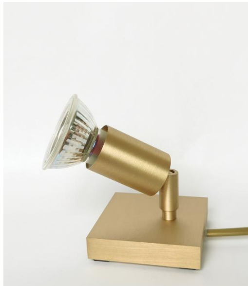
MERCURE PL en laiton satiné. Finition du métal : code 25