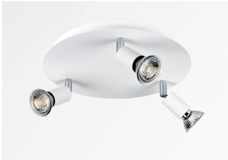
MERCURE ROUND 3 en blanc structuré. Finition du métal : code 01