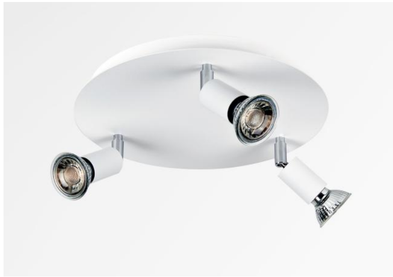
MERCURE ROUND 3 en blanc structuré