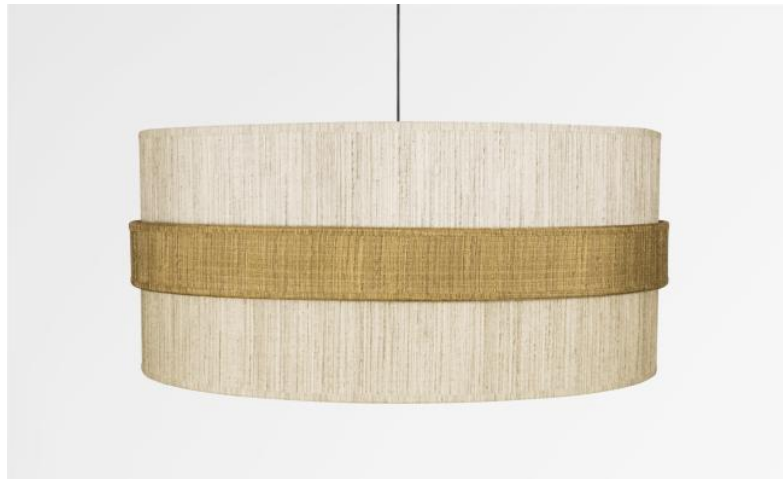
Abat-jour TOUYA 60 en Turda blond (tissu de catégorie 3) avec anneau en Turda abricot