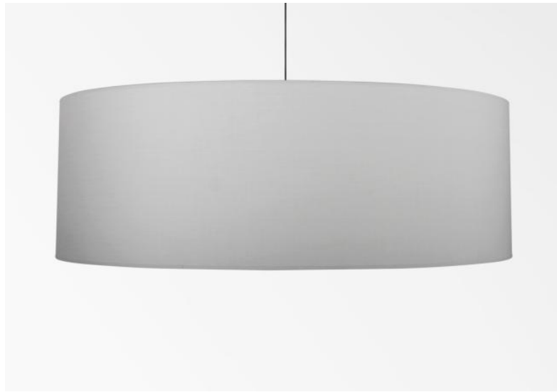
Abat-jour KENTIKA 90 en Coton tourterelle (tissu de catégorie 1)