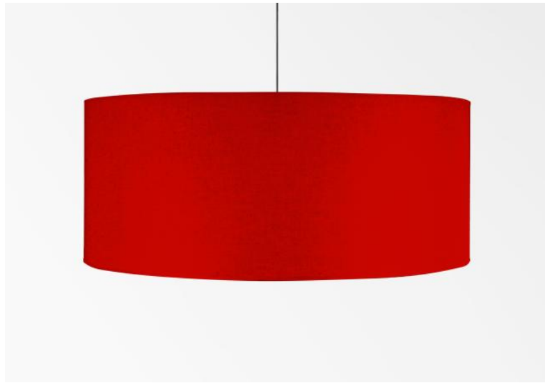
Abat-jour KENTIKA 80 en Coton rouge (tissu de catégorie 1)