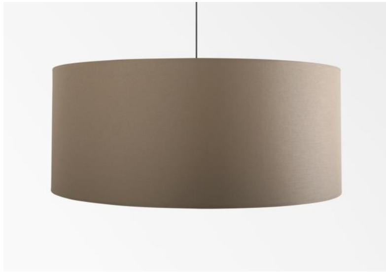
Abat-jour KENTIKA 70 en Seta taupe (tissu de catégorie 3)