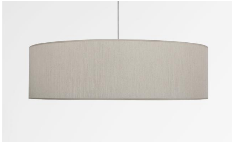
Abat-jour KENTIKA 70 SHORT en Crémone (tissu de catégorie 3)