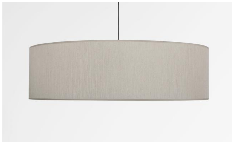
Abat-jour KENTIKA 70 SHORT en Crémone (tissu de catégorie 3)