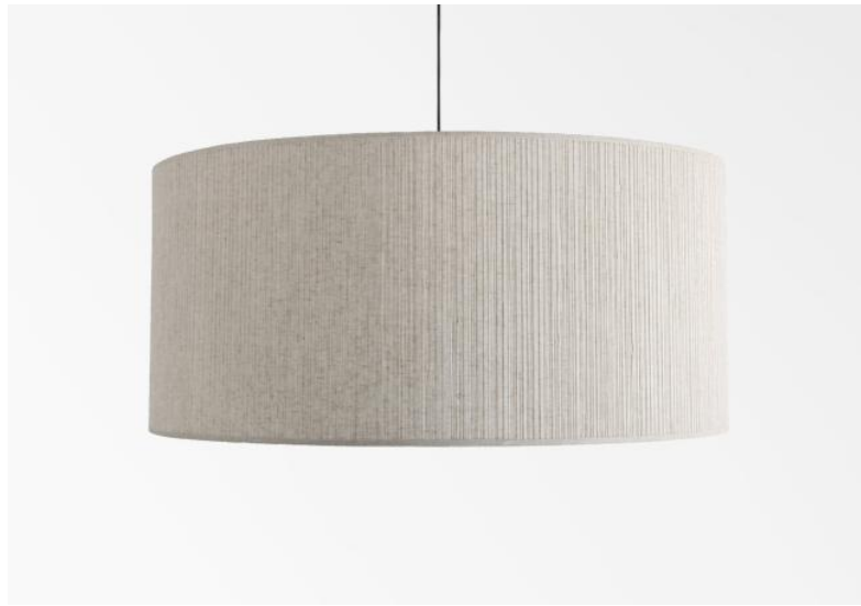
Abat-jour KENTIKA 60 en Plissé naturel (tissu de catégorie 4)