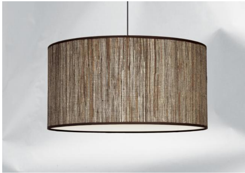
Abat-jour KENTIKA 45 en Jacinthe Miel Noir (matière de catégorie 5)