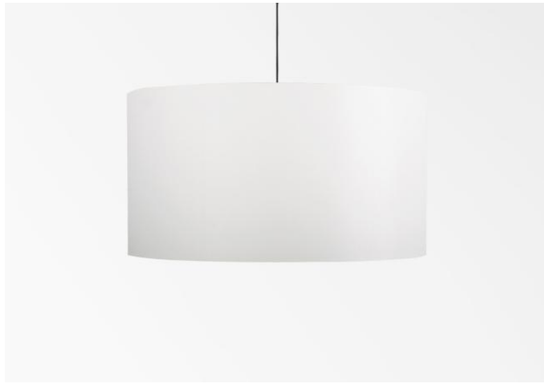
Abat-jour KENTIKA 45 en Chinette ivoire (tissu de catégorie 0)