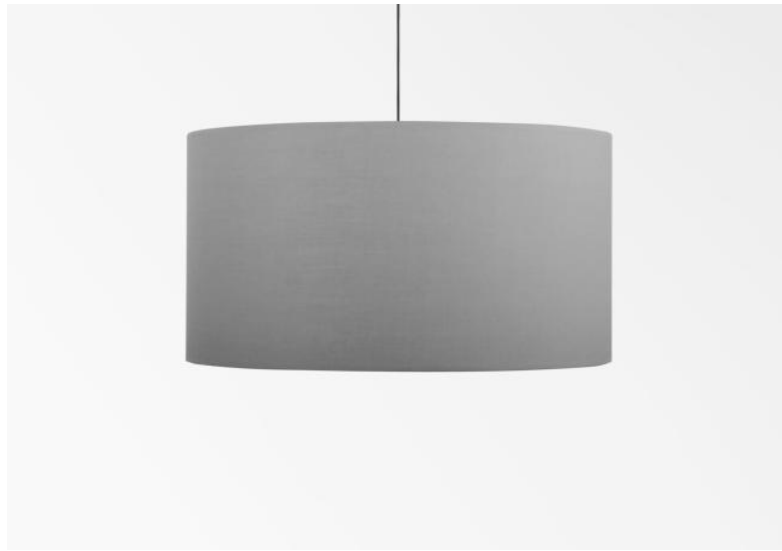
Abat-jour KENTIKA 40 en Coton gris (tissu de catégorie 1)