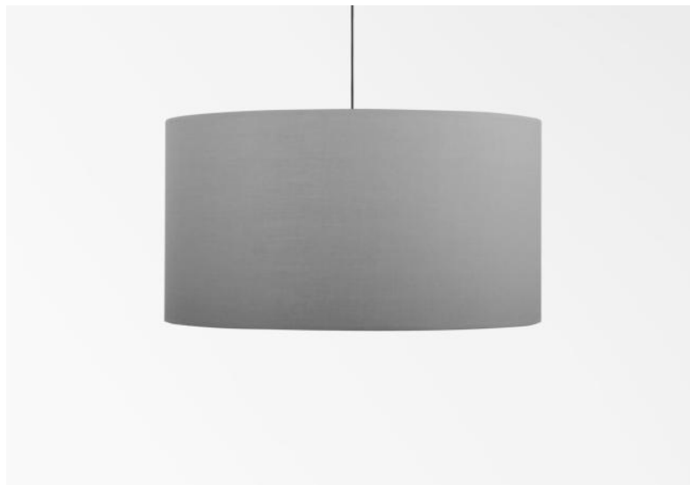
Abat-jour KENTIKA 40 en Coton gris (tissu de catégorie 1)