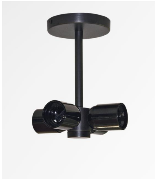
KENTIKA NOURRICE en bronze griffé