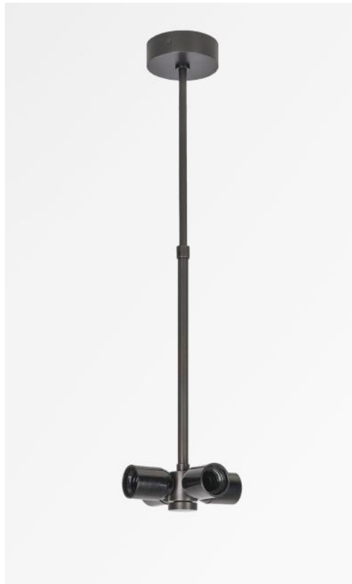
SUSPENSION GOLIATH en bronze griffé